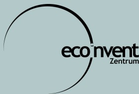
Schweizer Zentrum für Ökoinventare

Mit ecoinvent sind neu harmonisierte, generische Ökobilanzdaten hoher Qualität für die Bereiche Energie, Transport, Entsorgung, Bauwesen, Chemikalien, Papiere und Landwirtschaft, gültig für schweizerische und westeuropäische Verhältnisse verfügbar. Mittels der qualitätsgesicherten Datenbeständen von ecoinvent wurde eine weitere Basis gelegt, um die Ökobilanz als Umweltanalyseinstrument zu stärken.